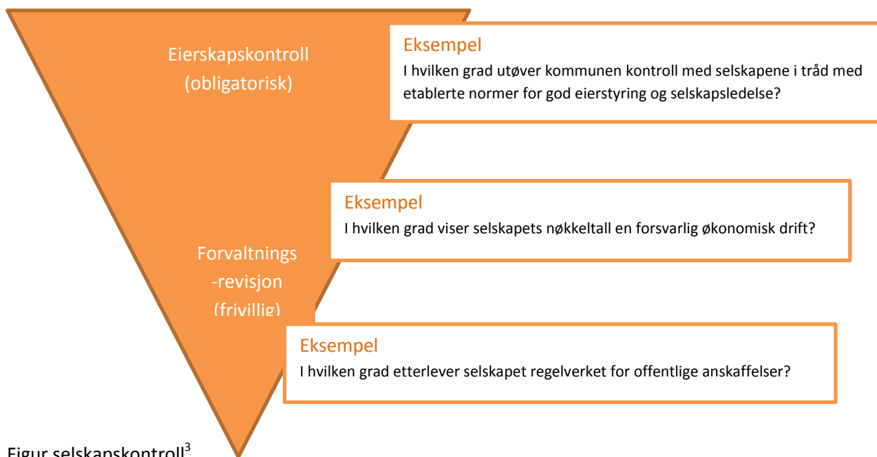
Figur selskapskontroll 3

I Kontrollutvalgsboken 2 side 61 er de forskjellige delene av selskapskontroll vist gjennom en slik figur: