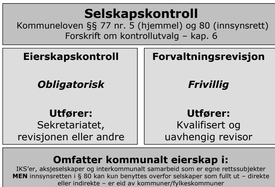
Figur: Selskapskontroll – overordnet skisse

Følgende figur viser selskapskontrollens omfang og innhold.