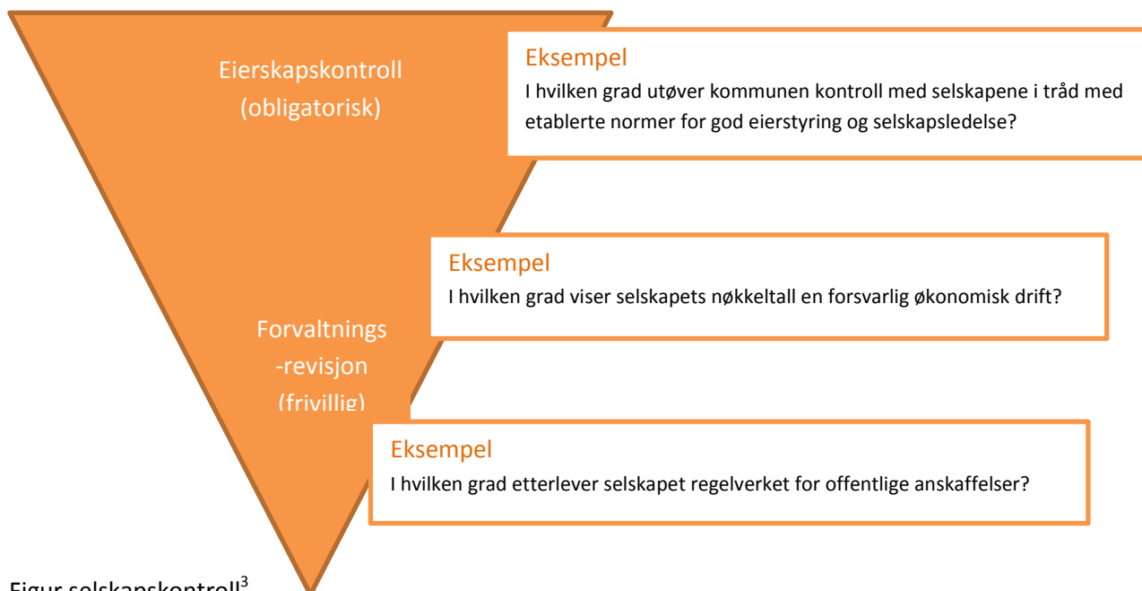
Figur selskapskontroll 3

I Kontrollutvalgsboken 2 side 61 er de forskjellige delene av selskapskontroll vist gjennom en slik figur: