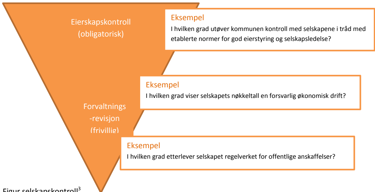
Figur selskapskontroll 3

I Kontrollutvalgsboken 2 side 61 er de forskjellige delene av selskapskontroll vist gjennom en slik figur: